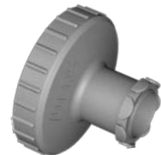
Adapter für Ritips®Professional 50 ml Adapter for Ritips®Professional 50 ml