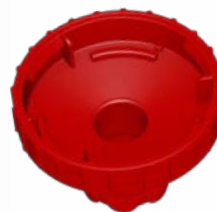
Adapter für Ritips®Professional 25 ml Adapter for Ritips®Professional 25 ml